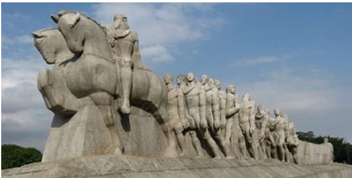
Figura 1. Victor Brecheret, Monumento às Bandeiras , 1953, granito de Mauá, 11 x 8,4 x 43,8 m. Parque do Ibirapuera, São Paulo.

Refletir sobre o passado exige atenção a um conjunto de aspectos relacionados à “recepção, interpretação e à transformação” (SANDLER, 2020, p. B-10) desses monumentos, que podem ser alcançados utilizando-se diversas estratégias. Por intermédio de operações de caráter perspectivista – com eficiente uso de sombras –, trabalhos da artista Regina Silveira (1939) colocaram em evidência e promoveram reavaliações de dois marcos históricos, ambos de autoria do escultor Victor Brecheret (1894-1955), situados em São Paulo: a colossal estátua equestre de Duque de Caxias (inaugurada em 1960), localizada na Praça Princesa Isabel, região central da cidade, e o Monumento às Bandeiras [Figura 1], encomendado em 1922 e concluído em 1953, no Parque do Ibirapuera.