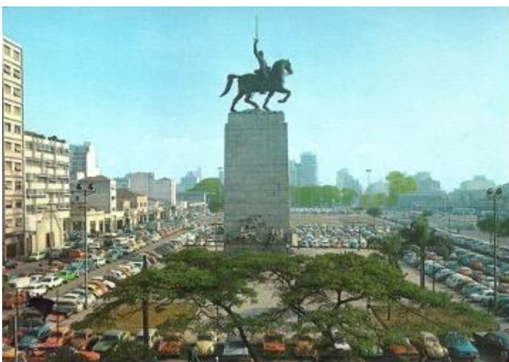
Figura 3. Regina Silveira, Brazil Today: Natural Beauties (1977), serigrafia sobre cartão postal, 10,5 x 15 cm.

Porém, não era a primeira vez que a artista problematizava o monumento. Dez anos antes, havia usado o conjunto escultórico numa fotomontagem da série Brazil Today: Natural Beauties na qual combina o icônico Monumento às Bandeiras com imagens de um cemitério de automóveis [Figura 3].