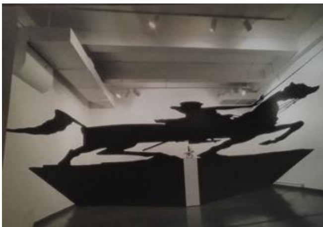
Figura 4. Victor Brecheret, Monumento a Duque de Caxias (1960), bronze, 15,88 x 41,0 x 13,20 m (sem o pedestal), São Paulo (SP). Postal da década de 1970, editado pela Edicard.

Já a estátua erigida para exaltar o patrono do exército [Figura 4] – que, na avaliação de Jorge Coli (2020, p. B-11), é o “despropósito de um heroísmo que poussa sobre um pedestal absurdamente alto” – foi apropriada em duas ocasiões. Em ambas, o Duque de Caxias – como ficou mais conhecido Luís Alves de Lima e Silva (1803-1880) – aparece na forma de uma “sombra monstruosa” (LEVIN, 1995, p. 230). O militar, entre outras batalhas, esteve à frente da Guerra do Paraguai que, estima-se, matou cerca de 300 mil paraguaios e 100 mil brasileiros.