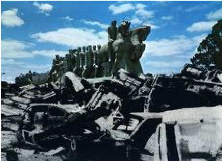
Figura 2. Regina Silveira. Monudentro , 1987, vinil adesivo, 160 m 2 , Exposição A Trama do Gosto , Fundação Bienal de São Paulo. Fonte: Regina Silveira

Monudentro [Figura 2], instalação de 1987 de autoria de Silveira, exibida na exposição coletiva A Trama do Gosto , realizada no Pavilhão da Bienal de São Paulo, questionou essa noção apologética.