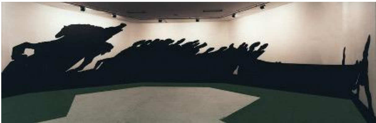
Figura 6. Regina Silveira, O Enigma do Duque (1995), maquete de projeto para o Memorial da América Latina, São Paulo (SP), 30 x 42 x 15 cm.

Idealizado em 1995 como um projeto para o Memorial da América Latina, O Enigma do Duque [Figura 6] não saiu da maquete. O trabalho – intervenção efêmera sobre a Biblioteca Latino-Americana – não recebeu o aval do arquiteto Oscar Niemeyer (1907-1912), autor do complexo cultural, “um local que remete tanto para a reavaliação de alguns mitos históricos quanto para a busca da união dos países latinos”, na visão de Angélica de Moraes (1995, p. 49).